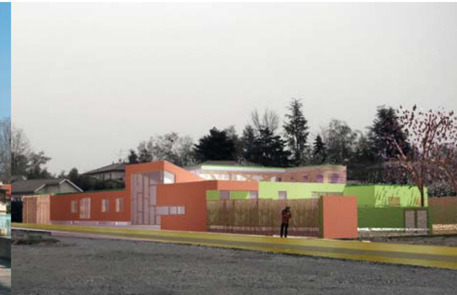
Pôle enfance et 7 logements à Saint-Symphorien-d'Ozon (69), 2005

Maîtrise d'ouvrage : ville de Saint-Symphorien-d'Ozon / Coût : 1 805 000 euros TTC / Surface : 1 371 m 2 SHON / DCE