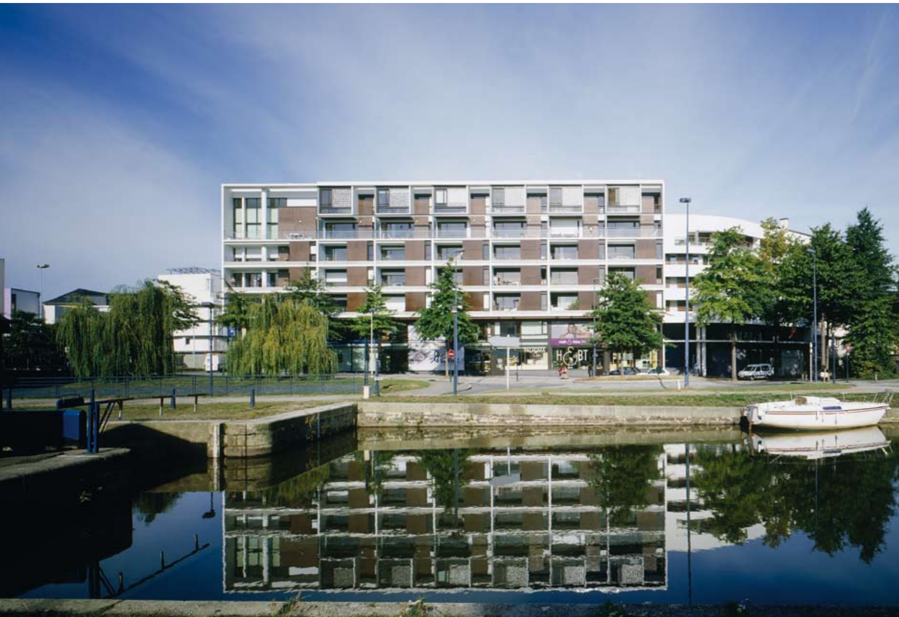
83 logements et commerces à Rennes (35), 2005 Programme : 83 logements en accession à la propriété, 12 commerces et 145 places de parking / Maîtrise d'ouvrage : groupe Giboire OCCL / Coût : 6 381 515 euros TTC / Surface : 8 410 m 2 SHON