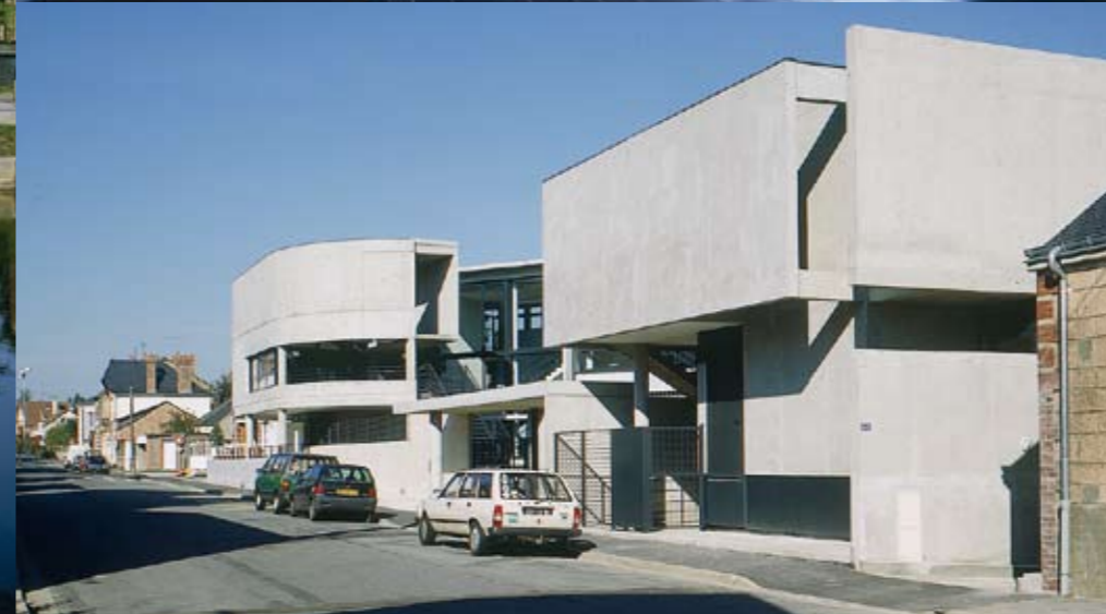
Siège social de l'OPDHLM de l'Orne à Alençon (61), 1997 Maîtrise d'ouvrage : OPDHLM de l'Orne / Coût : 2 880 138 euros TTC / Surface : 2 300 m 2 SHON