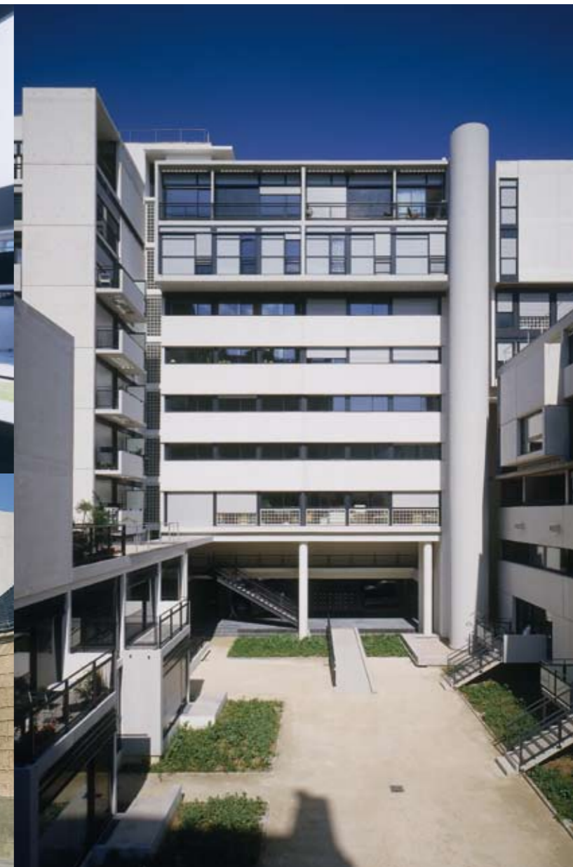
70 logements à Paris (75), 2000 Programme : 70 logements PLI, commerces et parking / Maîtrise d'ouvrage : SGIM / Coût : 7 076 189 euros TTC / Surface : 6 100 m 2 SHON