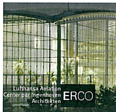
Lufthansa Aviation Center par Ingenhoven Architekten